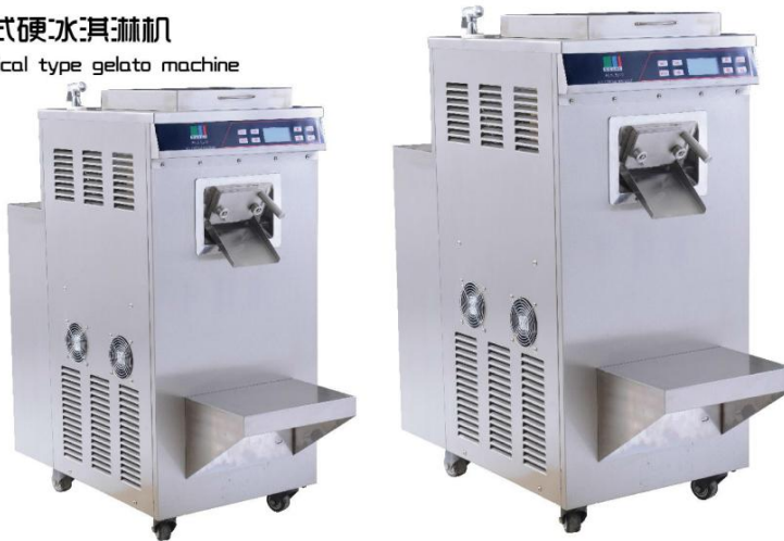
立式硬冰淇淋机 Vertical type gelato machine